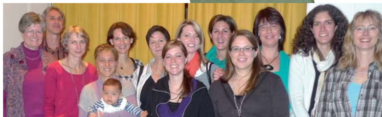
Die erfolgreichen AbsolventInnen der shp 2009...